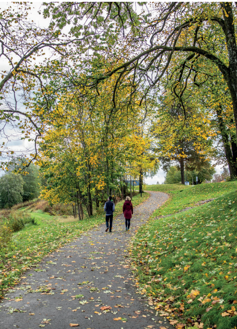
Sentrumsnær turvei rundt Hjellevannet, torsdag 29. september.

Område: Siljan Møtested: Samkjøring fra P-plass ved Skagerak Arena Tid: 10.00 Praktisk informasjon: Vi fyller opp biler og kjører kl 10.00. Ta med niste og kr 50 til sjåfør. Arrangør: Seniorgruppa i Skien Turlag Naturlos: Torkjell Berge Tlf: 913 10 322