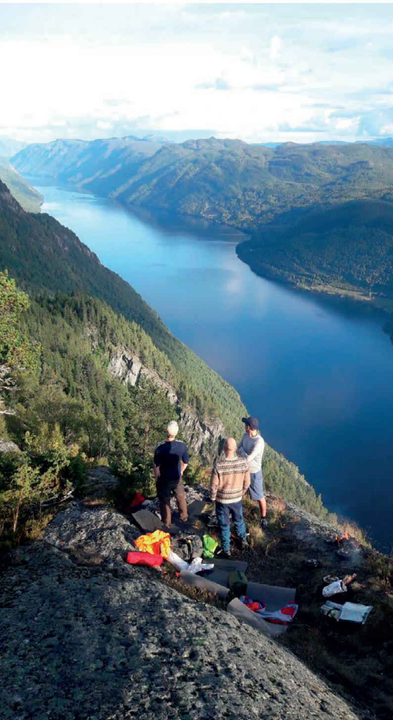
Spektakulær utsikt er belønningen for å gå Lårdalstigen, lørdag 9. september