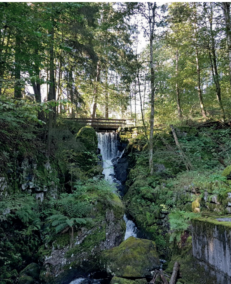
Besøk idylliske Kvernbekken nedenfor Kverndammen, torsdag 2. juni