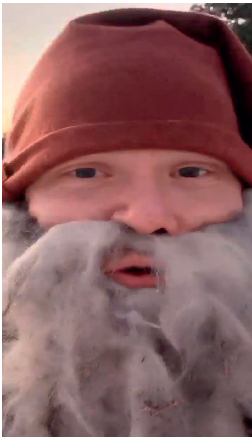
God jul fra skævnissen

Område: Skien Møtested: Skagerak arena Tid: 10.40 Praktisk informasjon: Lengde ca. 5 km. Ta med niste og kr. 50.- til samkjøring i private biler. Arrangør: Skien Turlag Kontakt: DNT Telemark Tlf: 35 53 25 55