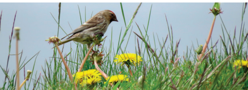
Du kan få øye på all slags fugler på Jomfruland, søndag 22. april

Område: Bamble Møtested: Skjærgårdshallen, hovedinngang Tid: 10.30 Praktisk informasjon: Transport fra Skjærgårdshallen 10.30. Start fra parkeringa på Krogshavn 10.45. Kontakt: Bamble kommune Tlf: 35 96 50 00