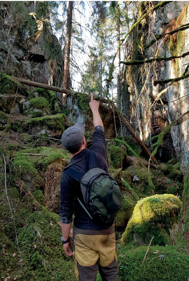
Vandre i trolsk skog på Håøya, søndag 24. april

Område: Skien øst Møtested: Skagerak arena Tid: 10.40 Praktisk informasjon: Lengde ca. 5 km,. Ta med niste og kr. 50.- til samkjøring i private biler. Arrangør: Skien Turlag Tlf: 35 53 25 55