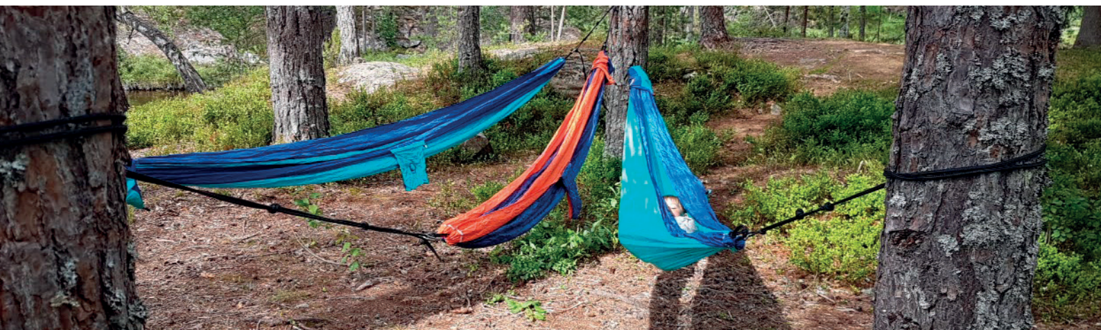
Heng med godfolk, fredag 13. mai

Område: Bamble Møtested: Ved Fjordglimt Leirsted Tid: 10.00 Arrangør: Bamble Turlag og Barnas turlag Bamble Naturlos: Tor Suhrke Kontakt: DNT Telemark Tlf: 35 53 25 55