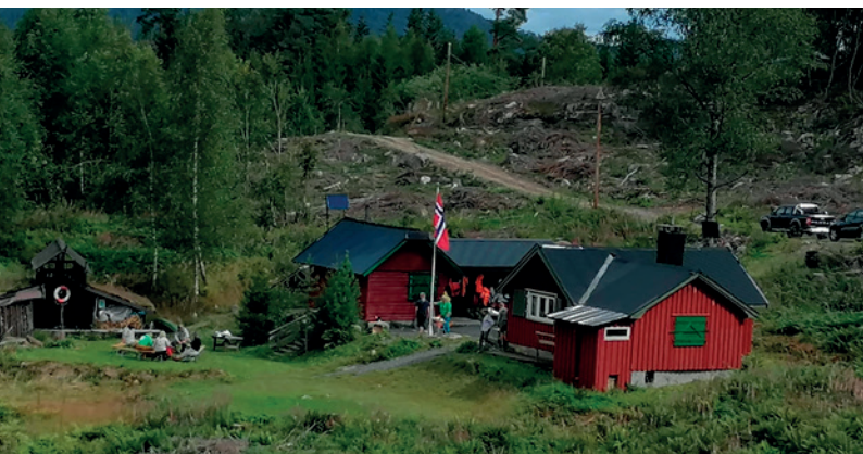
Prøv deg som speider på Lundseter, lørdag 20. august